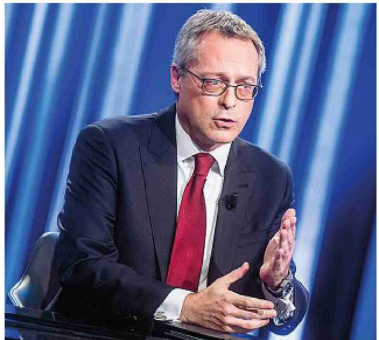
Viale dell'Astronomia Il presidente di Confindustria, Carlo Bonomi, 53 anni

Per Bonomi resta centrale l'abolizione dell'Irap per venire incontro alle esigenze delle imprese